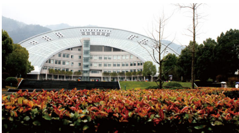
杭州外国语学校图书馆和信息中心