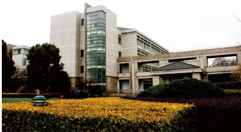
杭州外国语学校教学楼