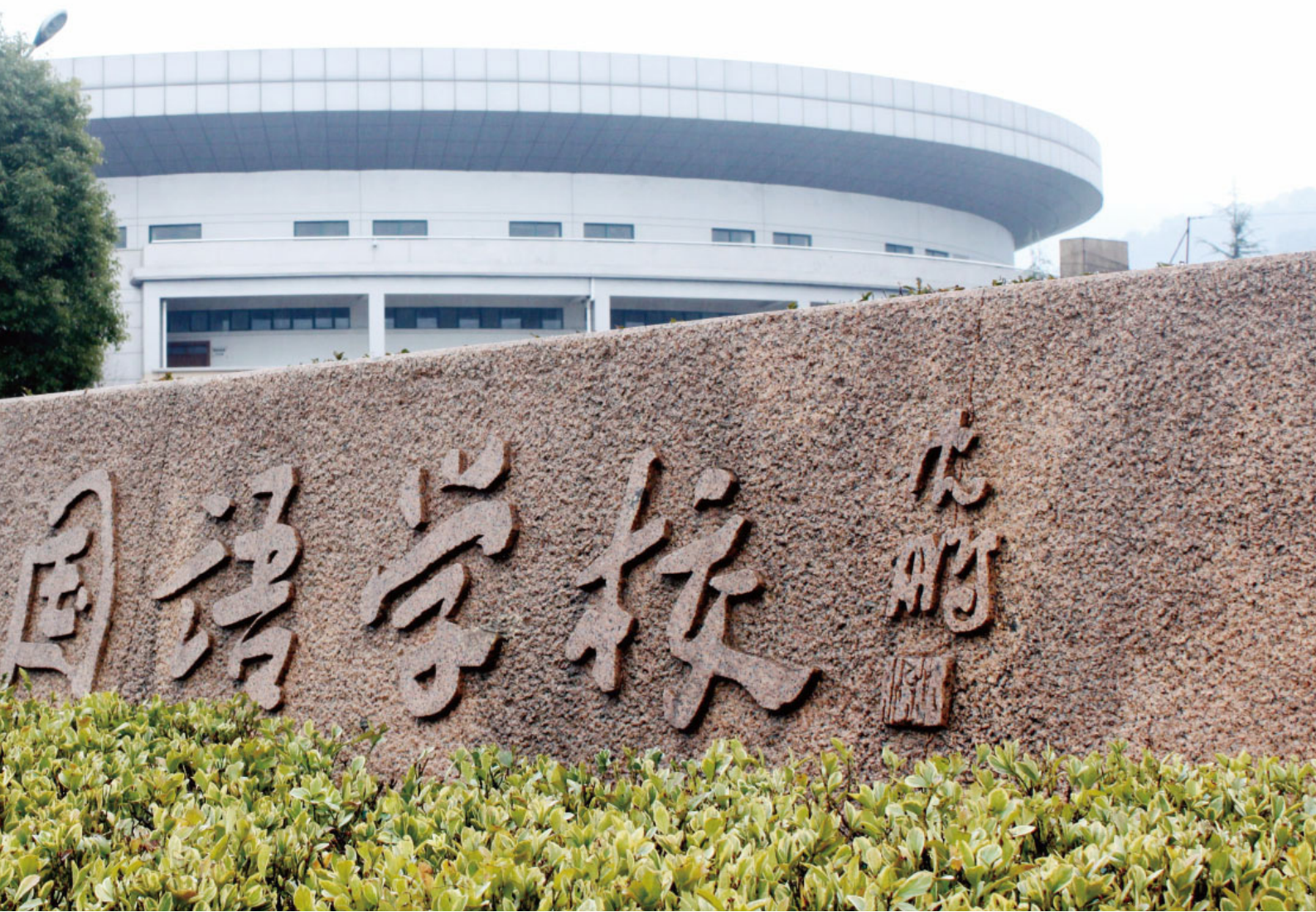
杭州外国语学校校门

于此认识,杭州外国语学校对于英语学科教学进行了重新定位,走出原来单一的文字教学和文本教学,开始融入文学教学、文化教学和文明教学,并将六“文”有机贯穿起来,提出英文教育(English language arts education)构想,并建构学校的英文(school-based English language arts)校本课程。